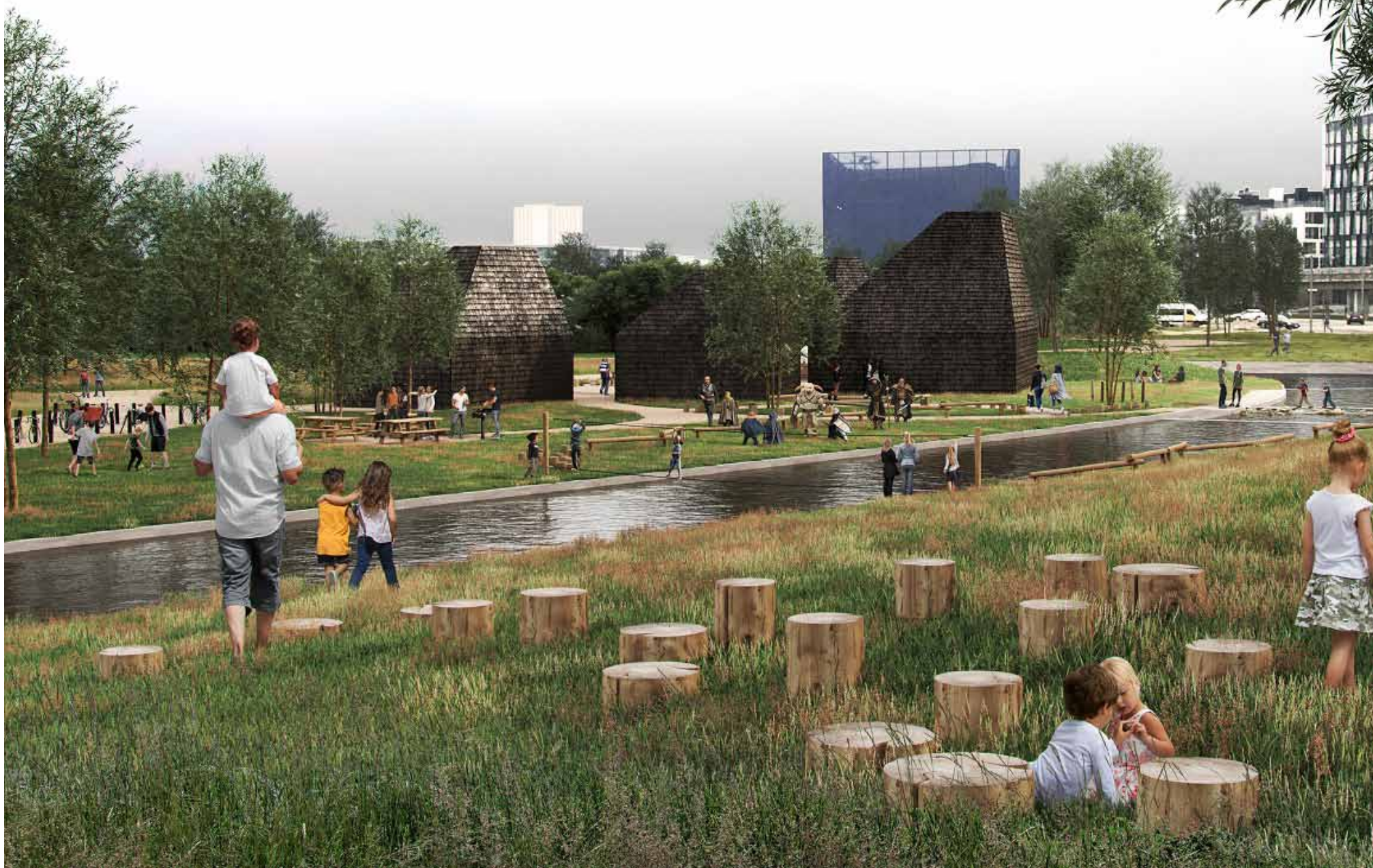
Indgang ved DR Byen set fra fælleden.

Mange borgere har ønsket tydelig overgang fra by til natur på Amager Fælled. Det ønske forsøger projektet Naturpark Amager at tilgodese. En ny bevilling på seks millioner kroner skal gå til netop en indgang ved DR Byen og et samlingspunkt ud for Havneslusen