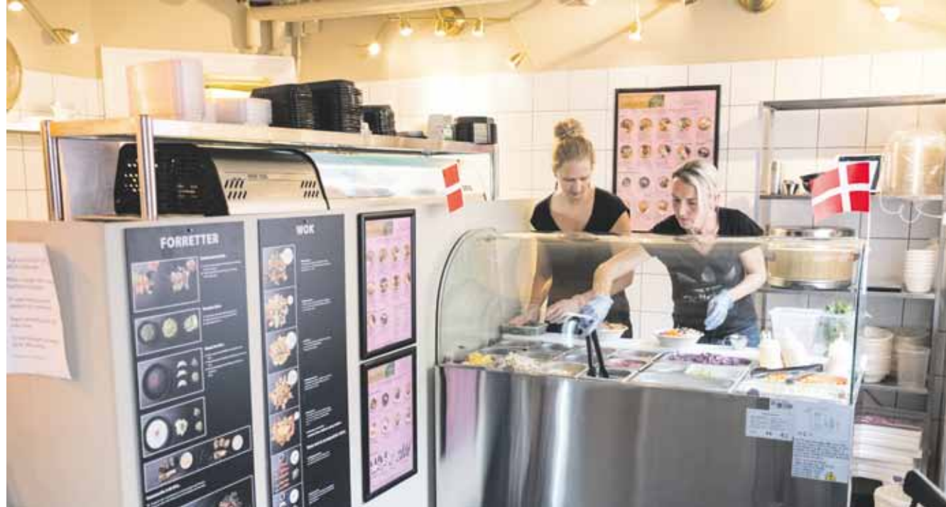
Miss Poké serverer den hawaiianske ret Poké i de nye lokaler i Thorshavnsgade.

Den tankegang har været kendetegnende for hende, siden hun åbnede Sushiya for 17 år siden. Dengang kørte hun rundt til forskel-