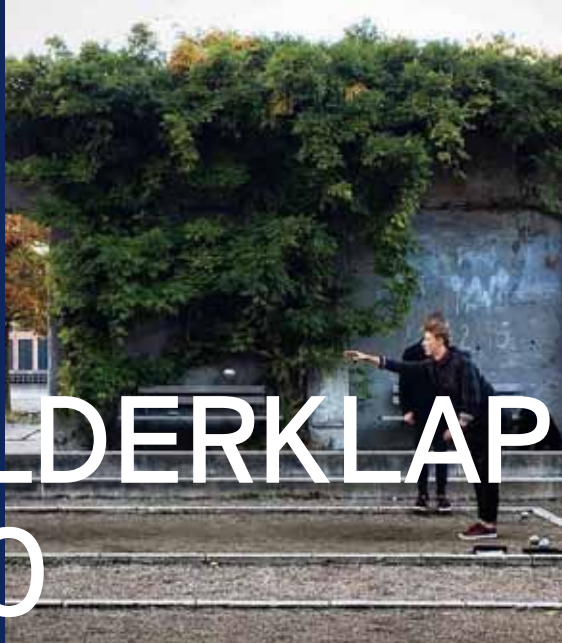
DER MØDTOG SKULDERKLAPPET I 2013

Send en mail med dit forslag og begrundelsen for indstillingen til info@avlu.dk senest søndag d. 15. november kl. 23.59. Læs mere om Skulderklappet på www.avlu.dk .