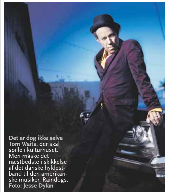
Det er dog ikke selve Tom Waits, der skal spille i kulturhuset. Men måske det næstbedste i skikkelse af det danske hyldesband til den amerikanske musiker, Raindogs.

Den amerikanske musiker og skuespiller Tom Waits er en mester ud i fortællinger og løgne. Det er svært at finde ud af, hvad der er sandt, og hvad der er opdigtet, både i hans musik og når han en sjælden gang lader sig interviewe. Men det betyder ikke så meget, for bag de smukke historier, der oftest handler om skæve eksistenser og håbløs romantik, gemmer der sig en større ægthed end det, den mondæne sandhed kan diske op med.