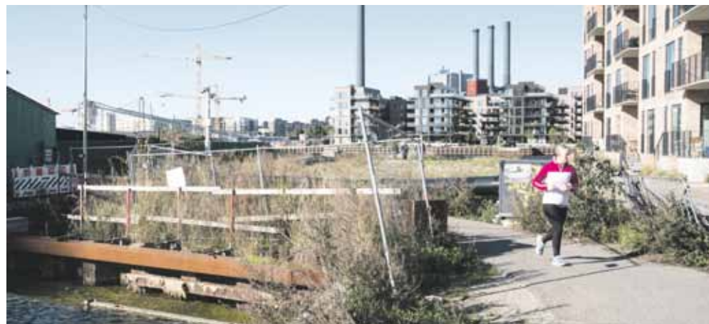
Der bliver en smule længere fra syd til nord, når cykel- og gangtrafikken ledes rundt om Havneviggen mens den bliver gravet ud til havnen.

Ønsket fra Teknik- og Miljøforvaltningen var nemlig oprindeligt, at den nuværende forbindelse over vigen skulle opretholdes, så cykel-, gang- og løberuten 'Havneviggen' ikke blev brudt. Dog var forvaltningen åben for løsningsforslag fra grundejerforeningen, så trafikanten ikke kommer i konflikt med byggepladsen, hvilket altså har ført til, at trafikken nu føres uden om Havneviggen og ikke igennem byggepladsen.