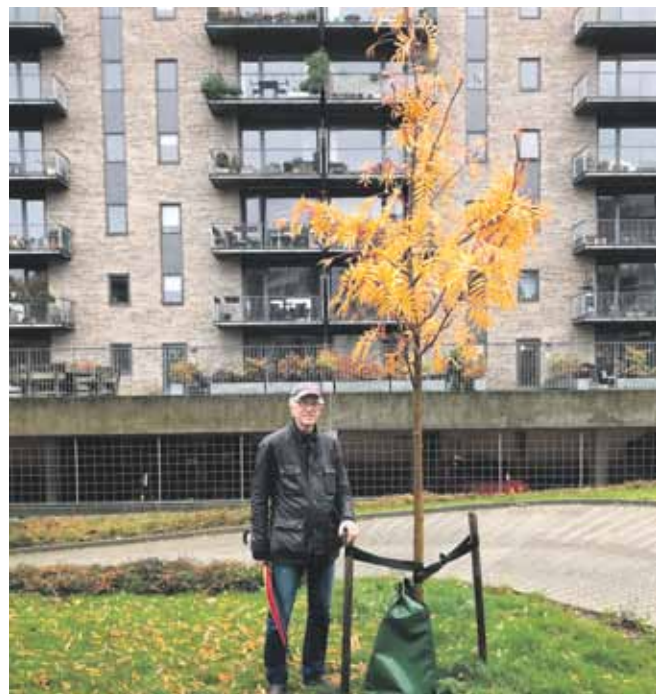
Træet Erling sammen med sin træpartner Erling.

nen. Dertil kommer næsten 40 partnerskabstræer fordelt på en række forskellige grunde på Nokken.