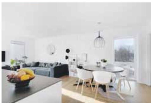
Central House - Amager Boulevard 112, 2. th.

Den arkitekttegnede ejendom, Central House, ligger helt perfekt i starten af Amager - tæt på metro, byliv, vand og natur. Her kan I nu overtage en eksklusiv 4'er fuld af dagslys, lækre løsninger og dyre tilkøb, og tilværelsen forsødes yderligere med sol på altanen og en flot udsigt mod Indre By!