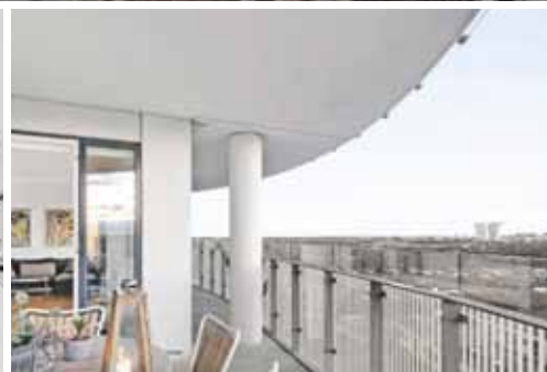
Islands Brygge - Rundholtsvej 28, 8. 2.

En altan, der har en 180 graders vinkel mod alle de bedste facetter af København løfter liebhaverlejligheden på Rundholtsvej 28, 8, 2, helt til tops sammen med den kompromisløse indretning og den attraktive adresse med Fælledens, havnen og byen lige foran hoveddøren. Velkommen