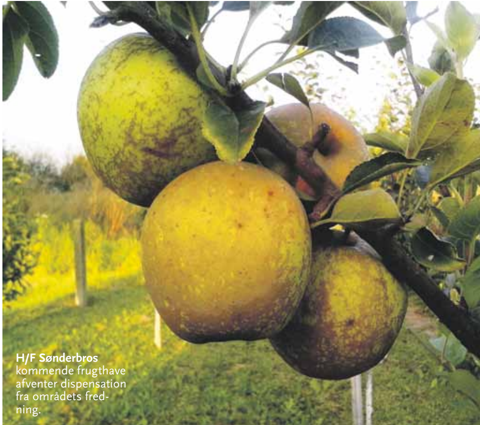
H/F Sønderbros kommende frugthave afventer dispensation fra områdets fredning.

► Behandlingen af dispensationsansøgningen kan tage op til 3-4 måneder. Gruppen bag frugthaven har søgt Amager Vest Lokaludvalgs bydelspulje om 75.974 kroner i støtte til plantning af de allerede indkøbte træer og buske samt til et hegn omkring plantagen.