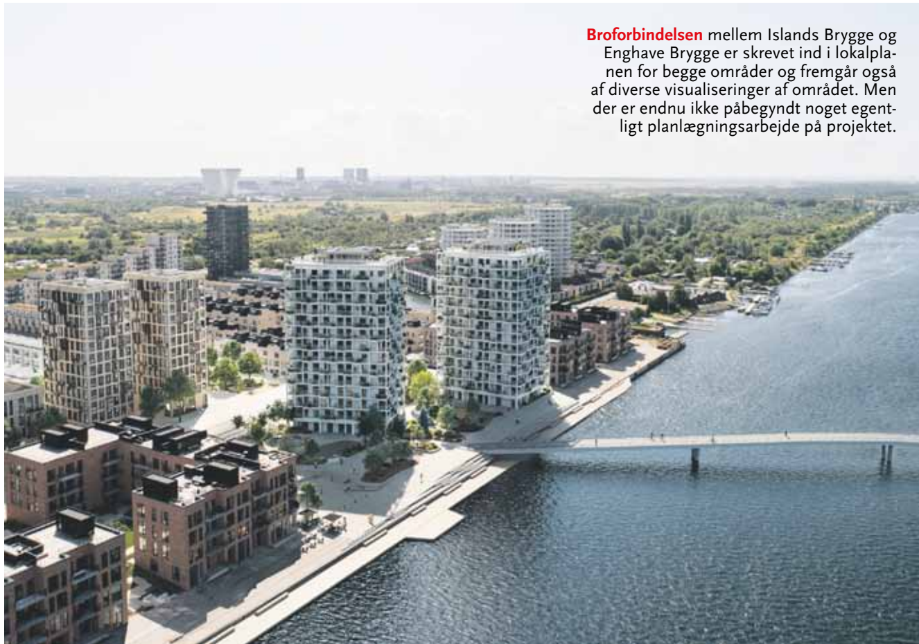
Broforbindelsen mellem Islands Brygge og Enghave Brygge er skrevet ind i lokalplanen for begge områder og fremgår også af diverse visualiseringer af området. Men der er endnu ikke påbegyndt noget egentligt planlægningsarbejde på projektet.

Der er heller ikke regnet på prisen for en mulig bro mellem Islands Brygge og Enghave Brygge, men både længden og placeringen af broen minder om den kommende bro mellem Teglholmen og Amager Fælled, som er anslået til mellem 144 millioner kroner og 178 millioner kroner.