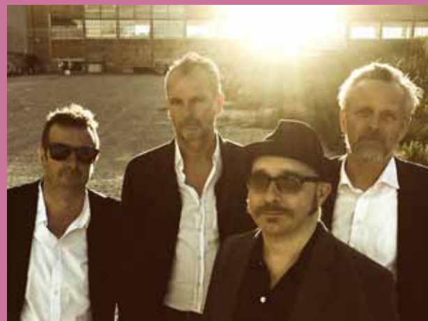
25/6 Falderebet // The Reptones