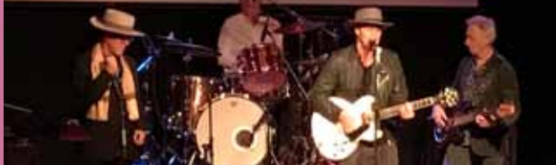
4/6 BandDylan – Congratulations your Bobness