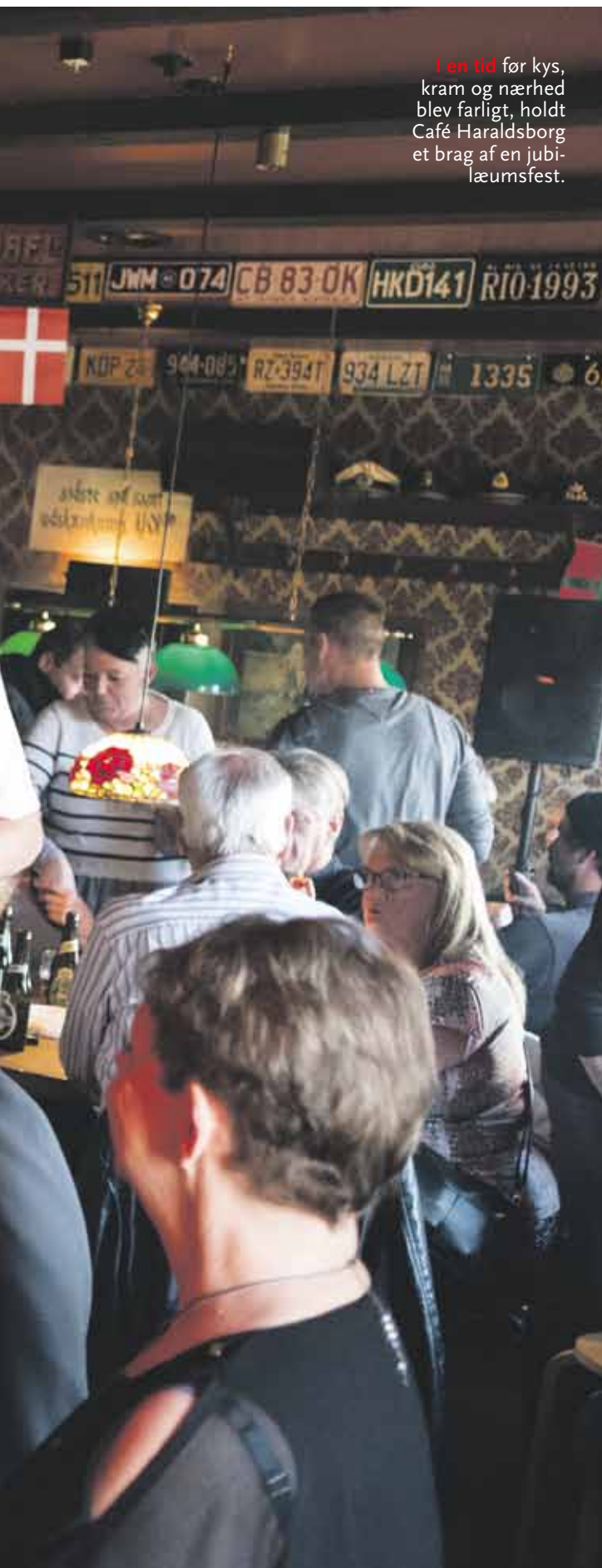
I en tid før kys, kram og nærhed blev farligt, holdt Café Haraldsborg et brag af en jubilæumsfest.