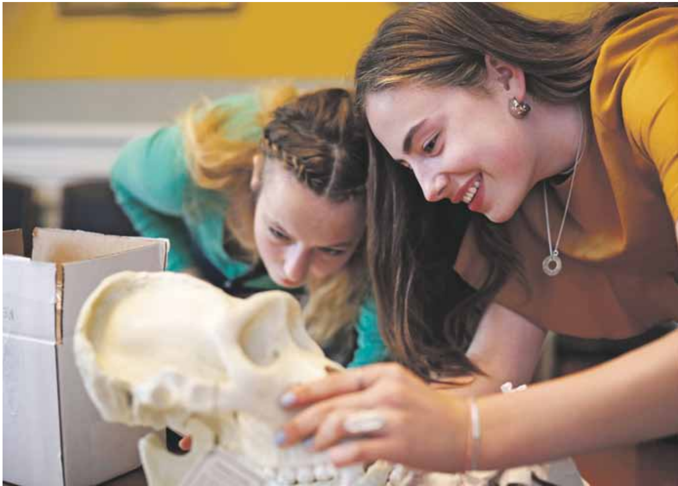
Er der forskel på et menneskes kranium og en abes?

Hvor meget - eller hvor lidt - adskiller vi mennesker os egentlig fra vores fjerne primat-fætre og kusiner? Det og meget andet kan du og din familie blive klogere på, når Videnskabsklubben for anden gang afholder workshop for familier i Kulturhuset Islands Brygge. Denne gang handler det om 'primater', som er den kategori i dyreverdenen, som både mennesker og aber tilhører. Gennem øvelser og leg vil I lære om nogle af primaternes særlige karaktertræk og slægtskab. I vil skulle undersøge kranier og sammenligne forskellige arter.