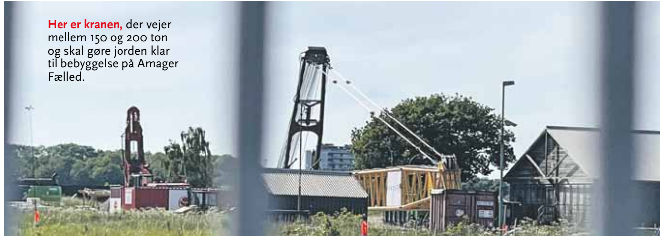
Her er kranen, der vejer mellem 150 og 200 ton og skal gøre jorden klar til bebyggelse på Amager Fælled.

Kranen vejer et sted mellem 150 og 200 ton, så derfor kom den til Fælled som et samlesæt på hele syv lastbiler. Derefter skal den samles og klargøres. Senere i processen kommer endnu en kran af den samme type til byggepladsen for at hjælpe med at udjævne jorden.