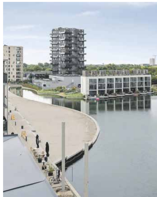
Fantastisk penthouse med tagterasse på Islands Brygge Islands Brygge 116, 3. TH.