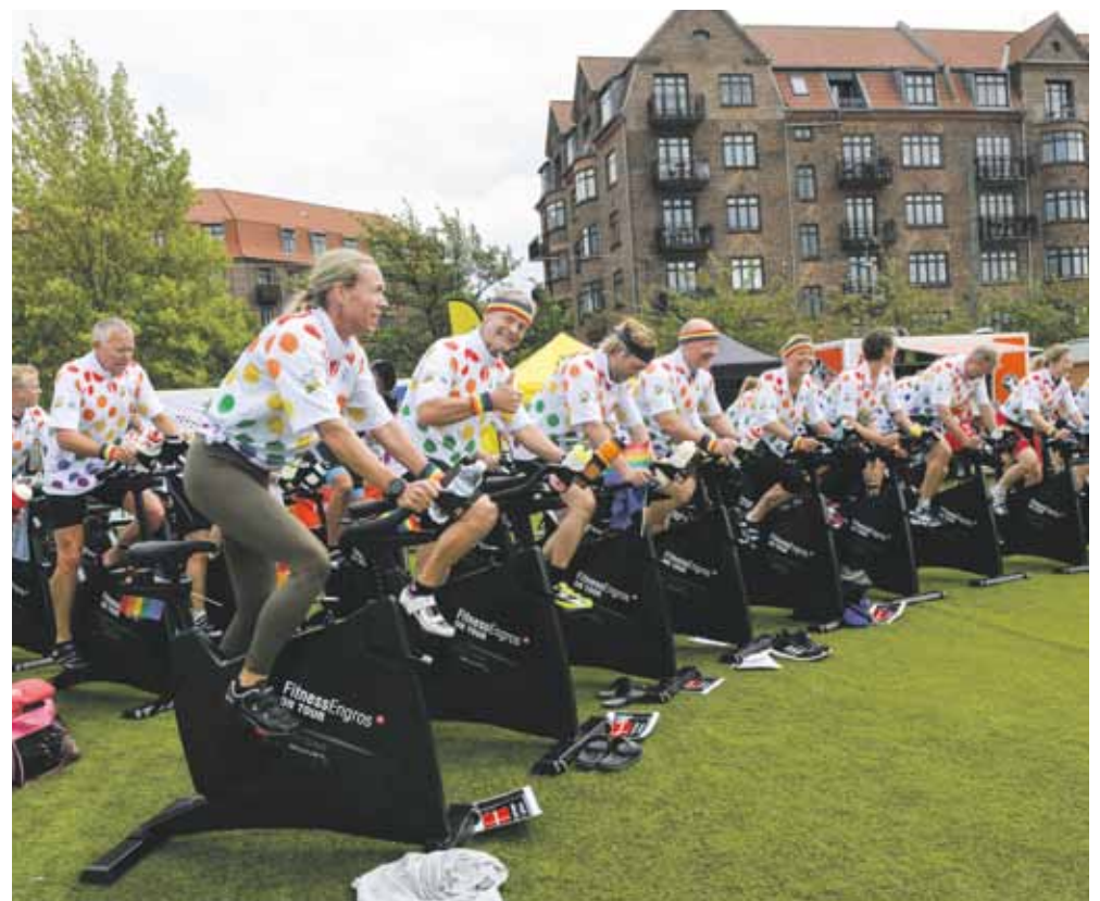
150 stationære cykler var stillet op i en stor halvcirkel, hvor der blev trampet taktfast i pedalerne til pumpende popmusik.