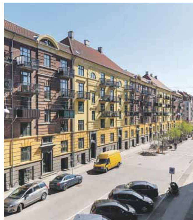
Lys 1V er på Islands Brygge Gunlogsgade 20, 2. 1.