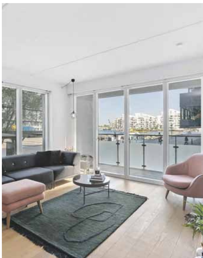
Stor og flot lejlighed på Islands Brygge Islands Brygge 75A, ST. MF.