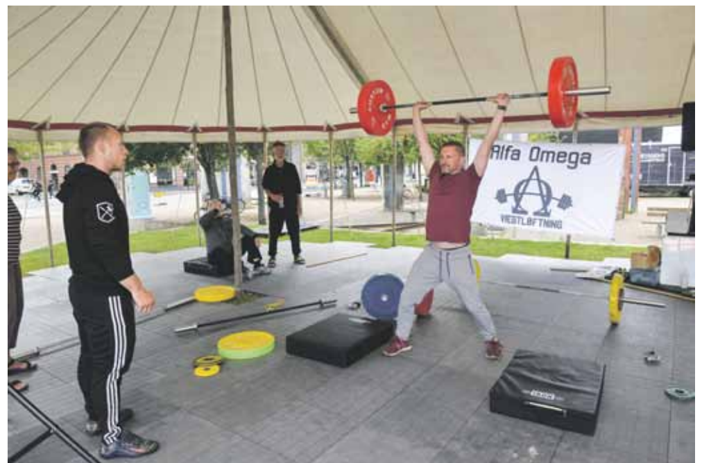
Vægtløftningsklubben Alfa og Omega, der træner, nørd og perfektionerer de olympiske løft 'clean', 'jerk', og 'snatch', havde taget pædagogiske vægtskiver med, der kunne få lette løft til at se imponerende tunge ud.