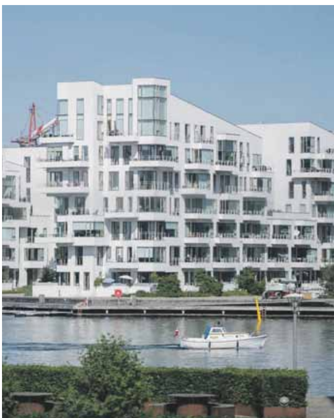
Få en sublim udsigt til vandet på Bryggen Islands Brygge 77B, 1.