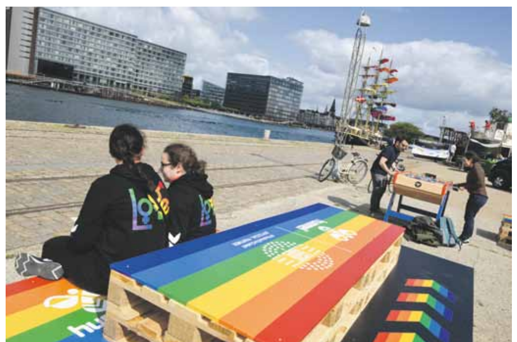
Der var kærlighed og inklusion i luften. Og ind imellem kiggede solen også forbi.