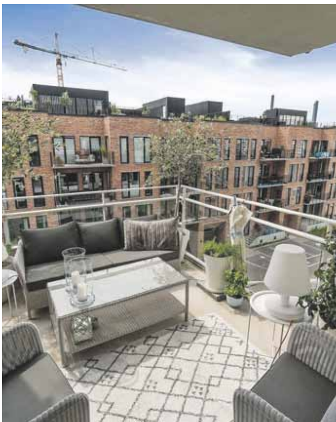
Lækker ejerlejlighed med to altaner på Islands Brygge Islands Brygge 38D, 3. TV.