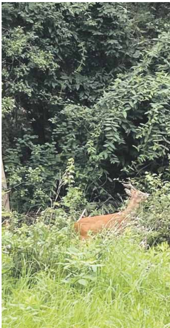
Flere naturoplevelser med hunden i snor.