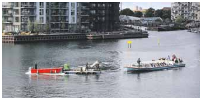
En Nettobåd måtte slæbes fri, efter den var gået på grund ud for Bryggebroen.

Selvom der er opsat skilte omkring det lavvandede område, siger By & Havn, at de nu for en sikkerheds skyld vil tjekke op på, om det er tilstrækkeligt