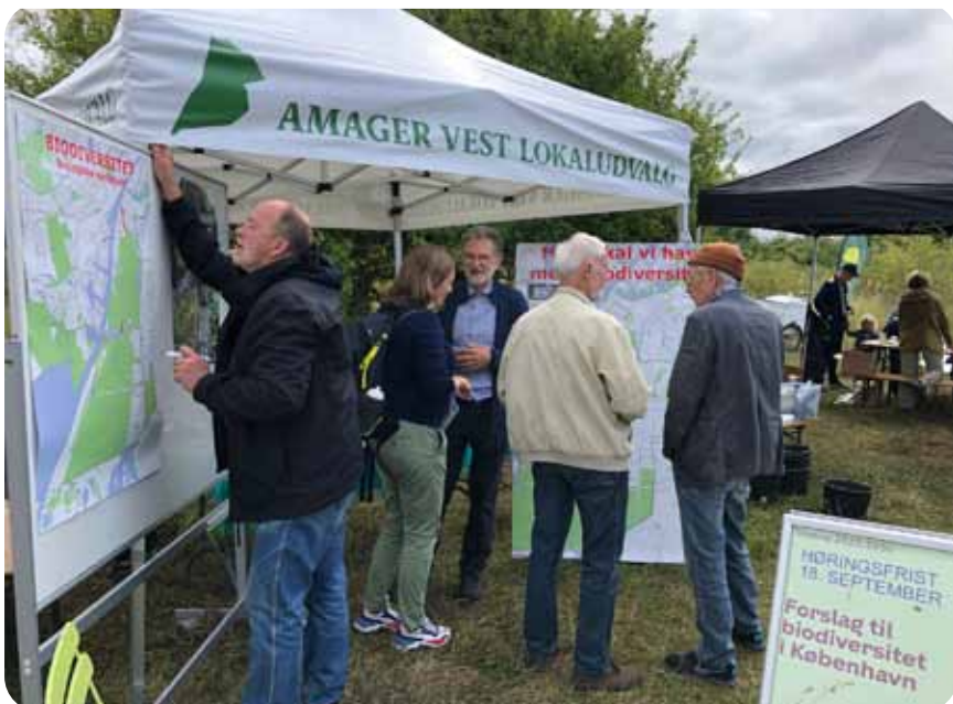
Amager Vest Lokaludvalg til Fælledens Dag 2022.