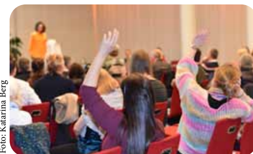
200 borgere deltog ved vores borgermøde om overdækning i 2022.

Derfor vil vi i 2023 bl.a. inddrage borgerne i spørgsmålet om, hvor de syntes, der trængte til træer i deres bydel. Vi har allerede planer om at afholde borgermøder ude i naturen. Hold dig opdatet på vores hjemmeside og sociale medier!