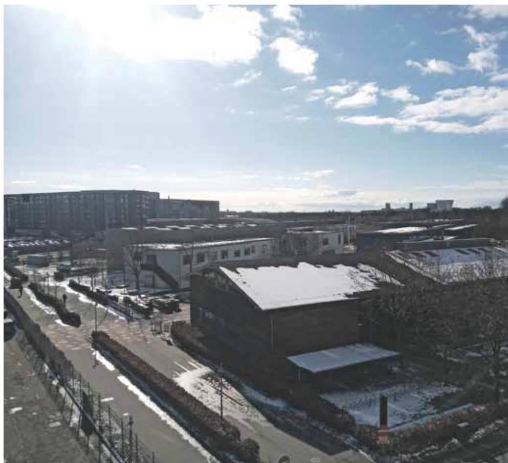
Nye bygninger ved Skolen på Islands Brygge på adressen Artillerivej 57. Fra en altan på den anden side af gaden var det lidt svært at få øje på, om der var næneværdige miljörigtige tiltag på skolens nye bygninger. Vi ringede derfor til skolens teknisk ansvarlige. Han kunne ikke svare med det samme og måtte låne en lift for at undersøge sagen. ”Tja, der er syv solpaneler på det nye tag”, sagde han. ljg