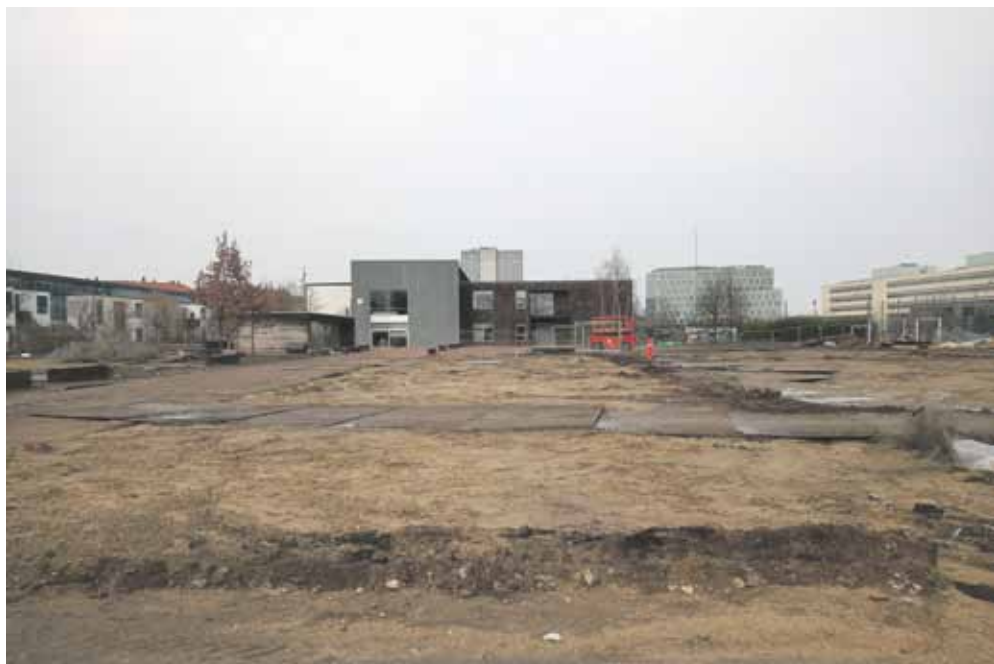
De midlertidige pavilloner er væk. Skal området asfalteres? Skal det være noget bæredygtigt? Eller skal det være en svømmehal? Vi hører gerne din mening.