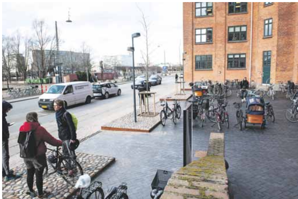
Tre træer. Her ses den nye indgang til Islands Brygge 37, også kendt som Bryggens Gård. Bygningen huser dele af Teknik- og Miljøforvaltningen (herunder Byens Drift) og Socialforvaltningen (Borgercenter Voksne). På billedet ses to af tre træer ved hovedindgangen. Istandsættelsen blev foretaget inden kommunens vedtagelse af en ny biodiversitetsplan. ljg