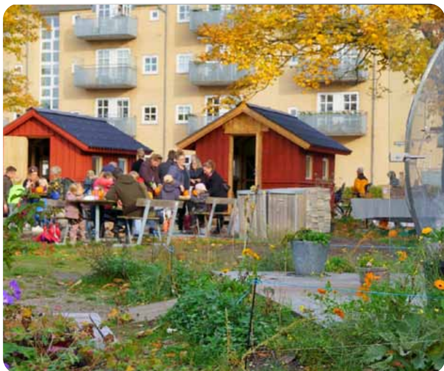
Borgere hygger sig på Kigkurren.