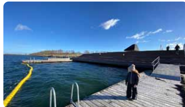
Fribadet ved kysten.

Det tredje og sidste område er et overdækket opholds- og udkigsområde. Dette område er et ideelt sted at slappe af og nyde den smukke udsigt over havet.