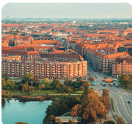
Klimatopmødet bliver på tværs af Amager.