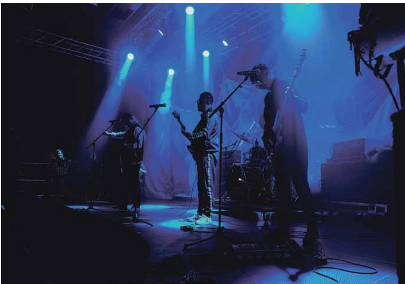
Det grønlandske indie-rockband Nuija spiller for første gang i København.

Koncert med grønlandske Nuija på Nordatlantens Brygge torsdag den 1. februar kl. 20. Billetter koster 150,- og kan købes på Billetto.dk .