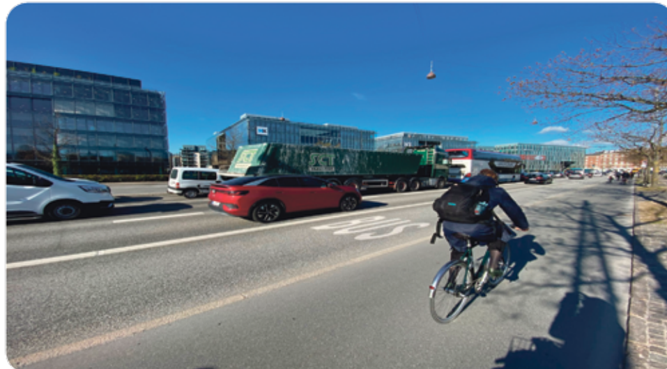
Tung trafik på Amager.