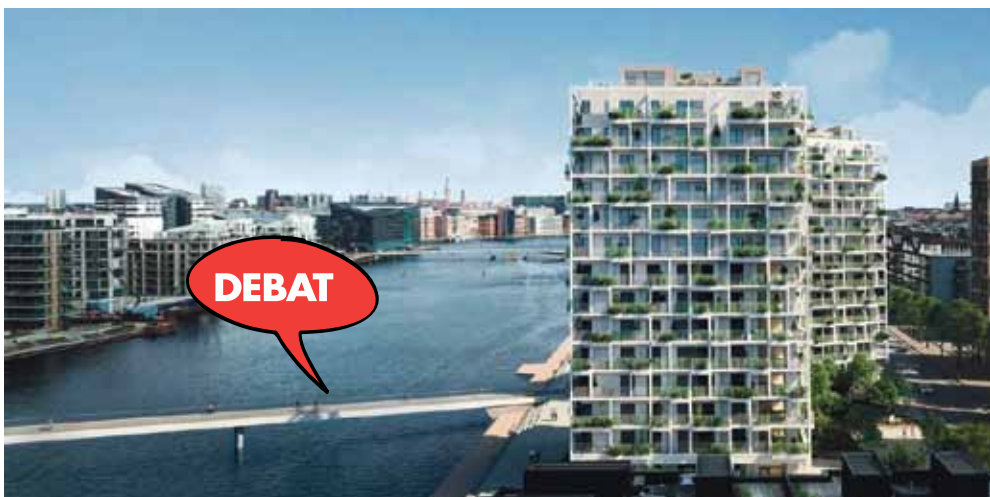
Illustration: Henning Larsen Architects