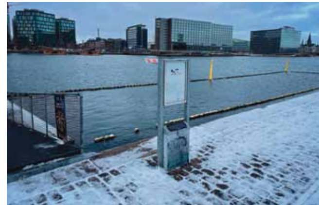
Fremover vil byens badevand blive testet løbende for såkaldte miljøfremmede stoffer.

Men selv hvis forslaget bliver vedtaget, skal der først findes penge ved de kommende forhandlinger om overførselssagen og sandsynligvis igen ved budgetforhandlingerne for 2025. Ifølge forvaltningen vil det løbe op i omkring 530.000 kr. årligt for prøvetagning ved de udvalgte badesteder.