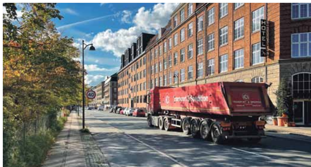
Der vil fortsat køre lastbiler med jord til og fra jordrensingsanlægget på Selinevej på skolevejen Artillerivej

Teknik- og Miljøforvaltningen oplyser, at man på baggrund af en henvendelse fra de to lokaludvalg på Amager vil gå i dialog med lokaludvalgene og sammen med Økonomiforvaltningen se på mulige løsninger på udfordringerne med jordtransport på hele Amager.