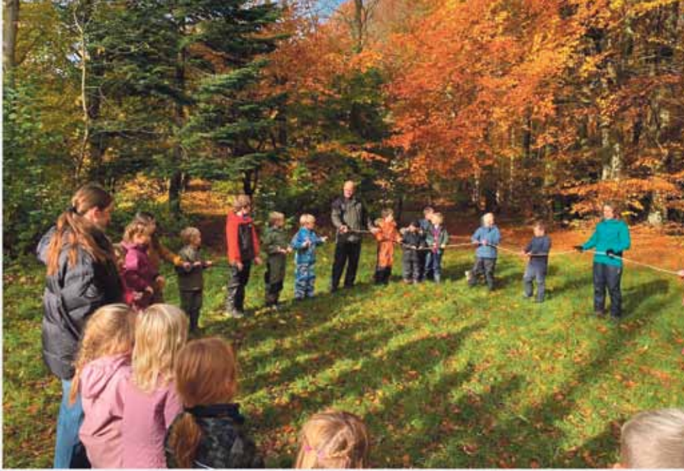
Foreningen Natur og Ungdom efterlyser lokale frivillige, der vil være med til at starte naturpatruljer på Amager Fælled.

- Hvis man er forældre og har børn, der gerne vil være med, så skal man også bare kontakte os. Vi håber på, at der er nok frivillige til, at vi kan få noget op at stå på Amager Fælled, for det er dér, københavnerne tager ud og oplever naturen. Så det er et oplagt sted at have et tilbud. Vi vil jo gerne have nogle børn, der har et tilhørsforhold til naturen, og som kan være fremtidens grønne agenter.