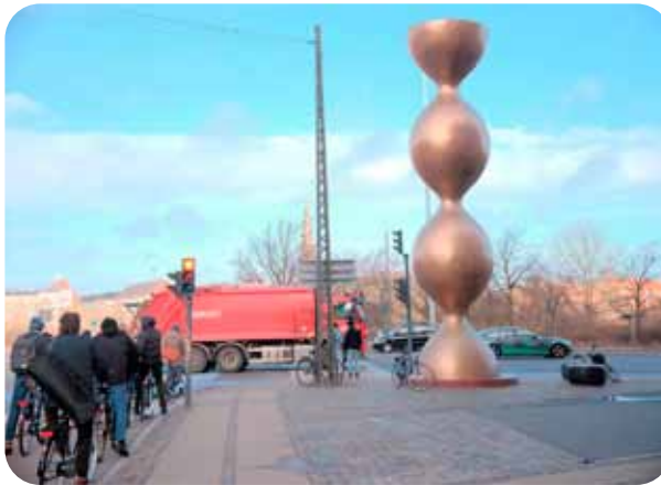
Zygote af kunstneren Sophia Kalkau.

blev afsløret sidste sommer og har siden stået som en indgangsportal til Amager. Trods en stor indledende debat er det dog lokaludvalgenes opfattelse,