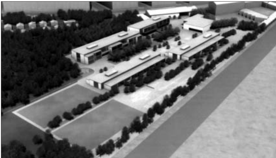
3D-model af Skolen på Islands Brygge efter udbygning til fire spor. Model: Københavns Kommunes forslag til lokalplan.

De vil i stedet rykke området et par hundrede meter sydpå og lade de cirka 20 huse, der ikke bliver berørt af skoleudbygning, blive stående. Næsten lige så bastant afviste kommunen dette ønske. Jørgen Munch fra Plan og Arkitektur ser ingen fremtid i, at haveforeningen skal rykke ind i et fredet område.