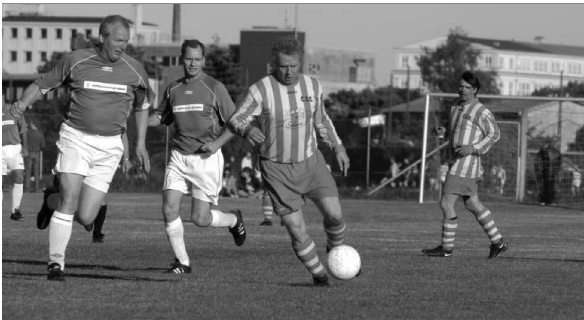
I sidste uge spillede et udvalgt Christianiahold fodboldkamp mod politiet. Politiet vandt 1-0.

Så er der endnu engang flyttet nye beboere ind i Havnestad – eller Islands Brygge Syd, som det efterhånden kaldes. Denne gang er det Fionia Hus, som ligger ved den grønne kile mellem Axel Heides Gård (Netto-bygningen) og Zeppelinerhallen. De nye beboere får Bryggebladet for første gang i dag. Velkommen til. agn