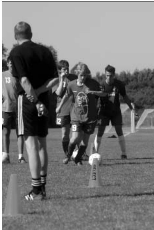
Heklas herrejuniorhold træner stadig, selvom de har sikret sig en god placering i mesterrækken.