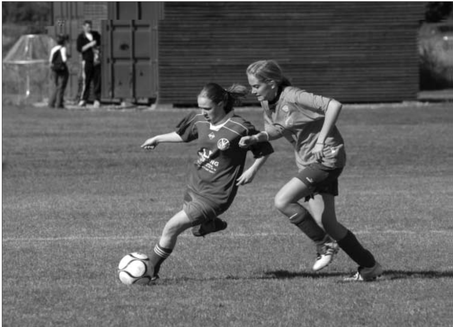
Heklas damejuniorhold vandt topkampen mod CIK med 3-2 og er nu kun et point fra førstepladsen. Hekla spiller i karakteristiske orange farver, der desværre ikke lader sig gengive i Bryggebladet.

Et meget godt eksempel på, hvilken betydning Hekla har for lokalsamfundet, samt hvilken betydning lokalsamfundet har for Hekla. agn