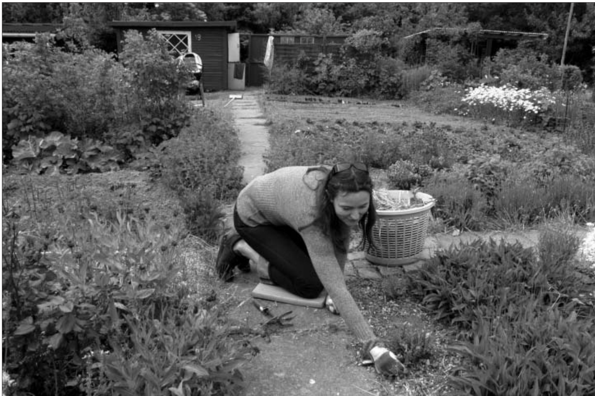
Bryggebladets fotograf Ricardo Ramirez fangede i søndags stemningen ved åbent hus-arrangementet i haveforeningen Faste Batteri.