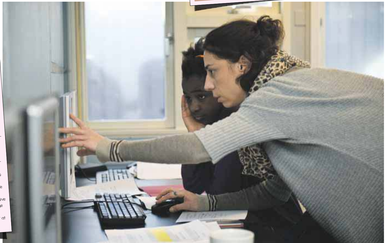
På den travle redaktion er børnene er ved at lægge sidste hånd på BBU Bladet. Der er to dage til deadline.