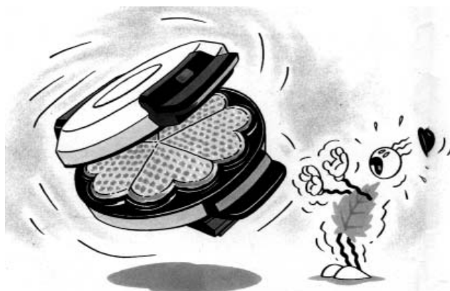
40 % af energiforbruget finder sted i køkkenet.

40 % af energiforbruget finder sted i køkkenet. De store el-slugere er køleska-