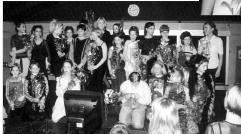
Efter konkurrencen er slut

Deltagerne under aftenmaden før konkurrencen (wow!)