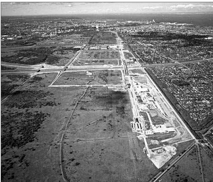
Et luftfoto af Ørestadsområdet taget fra syd.

Østre Landsret danner om knap to uger ramme om domsforhandlingen i en sag, som i hvert fald kritikerne af Ørestaden afventer med interesse. Nemlig sagen om hvorvidt reglerne i EU's såkaldte VVM-direktiv blev tilsidesat ved Ørestadslovens vedtagelse.