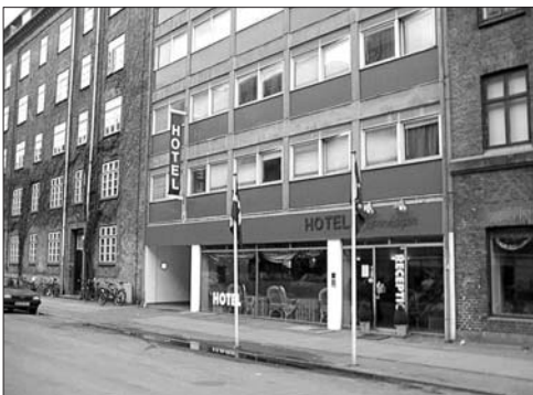
Stemningen er nervøs blandt de 30 flygtninge der siden efteråret har opholdt sig på Bryggens lokale Hotel i København.