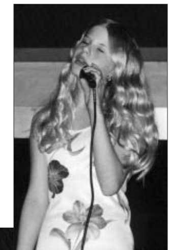
Isabella synger Madonnas »Like a prayer«

specielt øjeblik at overvære de unge opleve stjerneglimmeret, mens de stor på en scene, med hen imod 5-600 tilskuere og giver alt hvad de har i sig. Det er en oplevelse der giver hår på brystet.