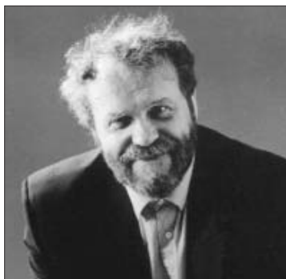
Sogneaften fredag den 12. marts kl. 19.30: Mod præst og forfatter Johannes Møllehave som vil tale om bøn.

Han læser af Edgar Allen Poes gotiske fortællinger, som altid går til grænsen for, hvad der kan siges rationelt. Det onde, det perverse og det groteske bliver hos Poe en slags negativ religiositet.