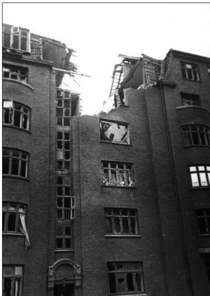
Gunløgsgade 6, 1943.