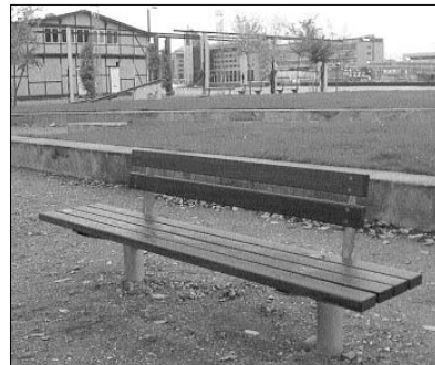
Der er åbenlyst ikke sparet ved materialevalget til den nye bænk, og det er næppe af spareårsager, at der ikke er armlænet og ryglænet er afkortet.

For længe siden er arkitekter og daværende parkchef gjort opmærksom på, at de forskellige betonbænke, der efterhånden er i Havneparken ikke opfylder de behov for siddekømfors, som de fleste mennesker ønsker. Mange ønskede at få den almindeligt kendte Køben-