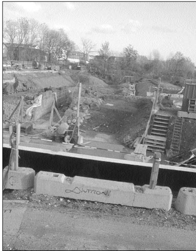
Ørestad Boulevard starter her. Da man skal til at danne et lille vandbassin i forlængelse af Faste Batteris vådgrav, er man nødt til at bygge en væg dér, hvor vandet møder boulevarden. Det er således bassinets kant og Ørestad Boulevardens underfortov, man har anlagt. Det er Faste Batteris gamle bro, som ses i baggrunden.