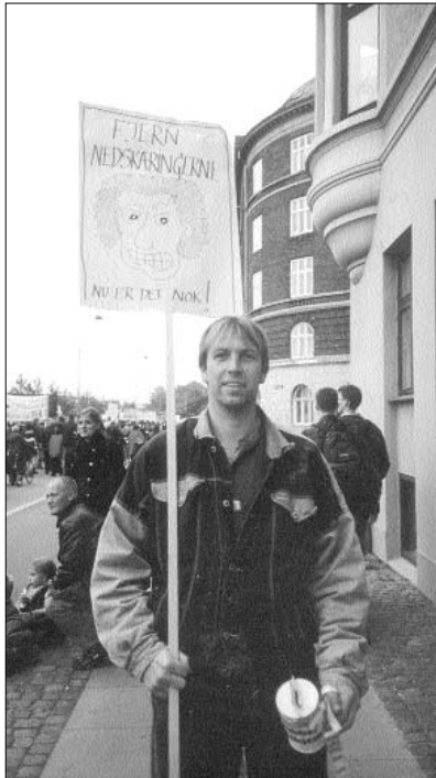
Pædagoger og forældre vandt slaget. De varslede nedskæringer på fritidshjemmenes åbningstider forsvandt under budgetforhandlingerne. Fire uger med demonstrationer og blokader gav resultat. Det bliver nu op til institutionernes forældrebestyrelser at tage stilling til åbningstider og andre prioriteringer.