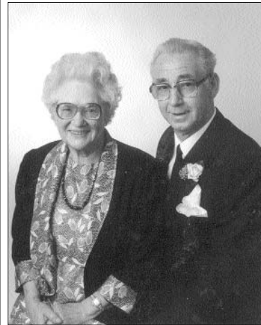
Kære Mor og Far. Stort tillykke med guldbrylluppet lørdag d. 11/11 2000.