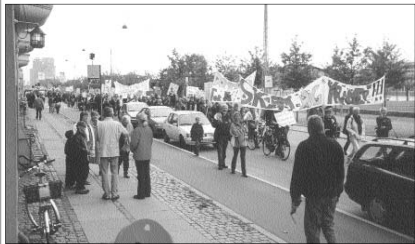
Det blev en dyr sejr for klub- og fritidshjems pædagogerne. 5-8000 kroner kommer det til at koste dem for at gå på barrikaderne for at bevare deres job.