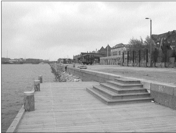
Så er træbryggen foran den nye havnestad anlagt, og man må konstatere, at hele kvarterets beboere har mulighed for sværmeriske oplevelser ved vandet. På sigt kan man håbe på, at havevandet vil blive så rent, at man også kan anvende den som udspringsplatform.