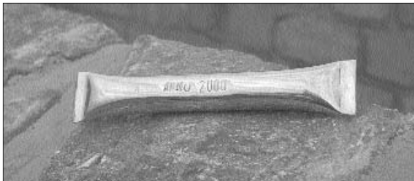
Et genrejsningsdokument med påskriften "anno 2000" indgraveret markerer Ørstedsselskabets genetablering af adgangsbroen til Faste Batteri.

omkring genetableringen. Der blev fortalt og beskrevet, kort og tegniger fra militærarkiver vist frem og bekræftede detaljerne i det arbejde der allerede var færdigt og linjerne i det, der var under udførelse.