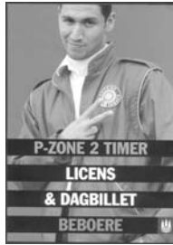
Er den ny parkeringsordning overhovedet god for noget? Effekterne af den diskuteres endnu.