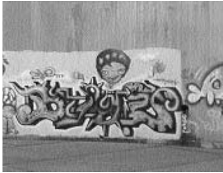
Der eksisterer større graffitiarbejder flere steder i lokalområdet. Her ved den nedlagte Sojakagefabrik.

Mange tusinde turister valfarter hvert år til tidlig europæisk graffitikunst, som i en længere årrække heldigvis har undslået sig lokale myndigheders overmalingsbevågenhed.