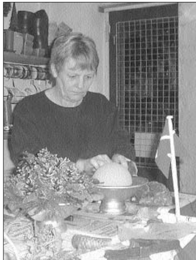
Der arbejdes koncentreret med at stikke trådede bær, blade og kogler ned i halvkuglen af oasis, som til forveksling ligner et lille, skaldet hoved.

Det var med en vis reservation, jeg sneg mig afsted på vej til mit absolut første møde med skrøbelige, tørrede blomster, spinkle blade og rustikke kogler. Faktisk havde jeg en smule dårlig samvittighed over at udsætte naturens gaver for mine klodsede fingre, og som aftenen skred frem, blev denne fornemmelse bestyrket. Blomsterbinder – dét har jeg simpelthen ikke finmotorik til at blive! Men der er der til gengæld andre, der har.