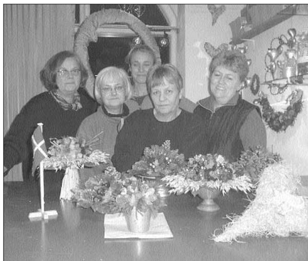
Det er et stolt hold, som viser resultatet af deres anstrengelser frem. Den lille forpjuskede dekoration forrest er begået af Bryggebladets udsendte.