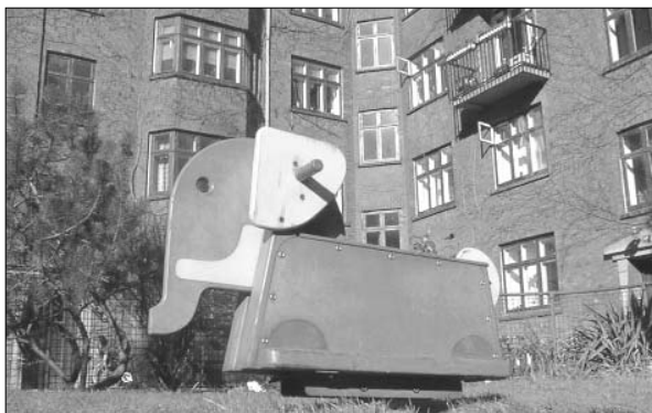
Trods billeder af ejendommen Store Thorlakkhus og overskrifter som 'Alt for dyrt' i bladets spalter lykkedes det alligevel at opnå en tilslutning på knap 60 % til købet af Store Thorlakkhus.

I andelsboligforeningen Halfdan, hvor man for nogle uger siden opnåede tilstrækkelig stor tilslutning til, at lejerne kan købe ejendommen, er det almin-