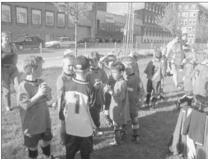
De særindkøbte dåsesodavand var et hit blandt Heklas med- og modspillere, da Hekla St. Bededag havde inviteret til sidste stævne på boldbanerne på Artillerivej.