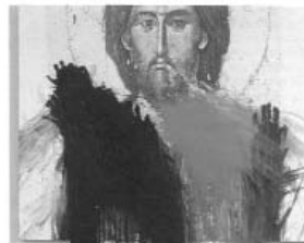
Arnulf Rainer: Kors 1987-89.

Men som sagt, en udgangspunkt og refleksionen af mit valg er, der må synges, ellers skal der ties. Dette med at tie stille har jeg ofte svært ved. Formuleringer på 1000 forskellige måder og en, synes jeg selv, forimidlertid evne til at se problemer, specielt andres, gør at det er godt at skulle tie. Tie og lytte har kirken plads til, der fordes ikke noget svar på det der siges i kirken. Det giver langt bedre rum i hovedet, når der ikke hele tiden skal produceres sætninger, og jeg får serveret glimrende tikster, som er nærværende og omsætt-