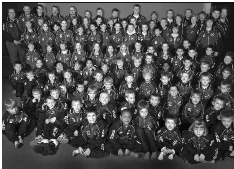
Succes historie. Medlems tallet i Heklas ungdom er nærmeste eksploderet i de sidste tre år. Med et nyt klubhus er det snart muligt at imødekomme de mange drenge og pigers ønsker at komme på et af Heklas efterhånden mange ungdomshold.

Kampen spilles onsdag d. 13. juni kl. 18:30 på Kløvermarken. Alle er velkomne!