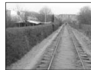
Hvad skal Freja bruge den seks meter brede jordstriben til, når kommunen laver grøn cykelrute på den nedlagte Amagerbane?

»Det er særligt at flere havde nået at rive deres huse ned.