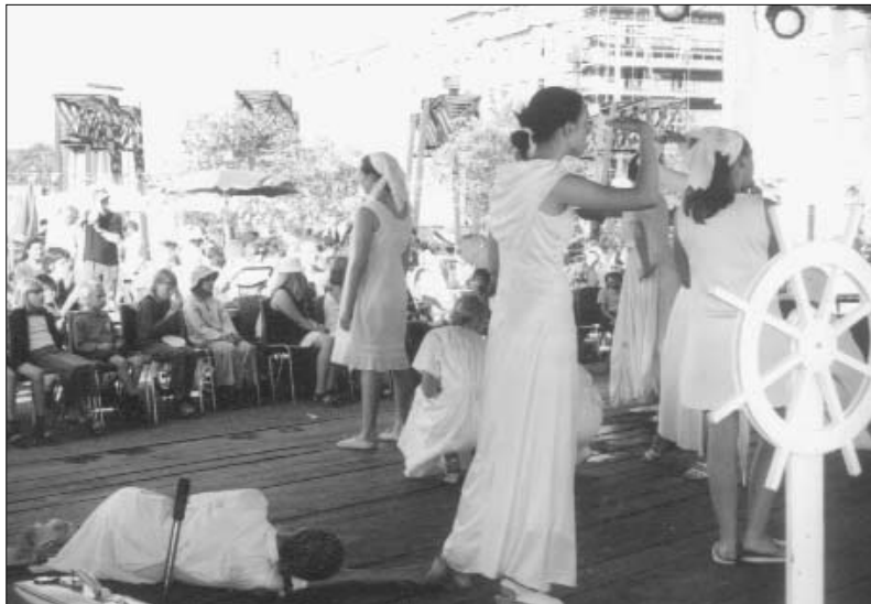
Filippinere optræder ved sidste års Bryggens Virkeligheds-arrangement.

Bryggen er igen et byggetressant område. Det gamle tætte boligkvarter