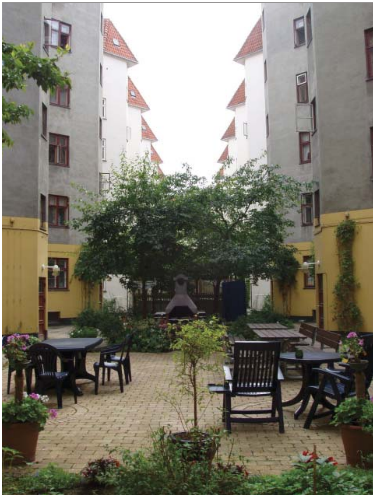
A/B Leifs gård ligger mellem Leifsgade, Bergthorasgade og Halfdansgade.

Vi besøger nogle af Bryggens mange gårde for at se, hvad der sker i hjertet af de ofte lukkede kareér.