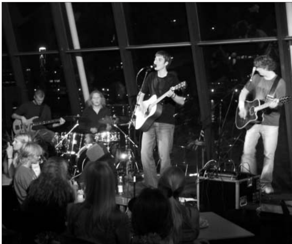
Foto fra kulturhusets første Plug'n Play arrangement den 16. august med bandet Airbag.