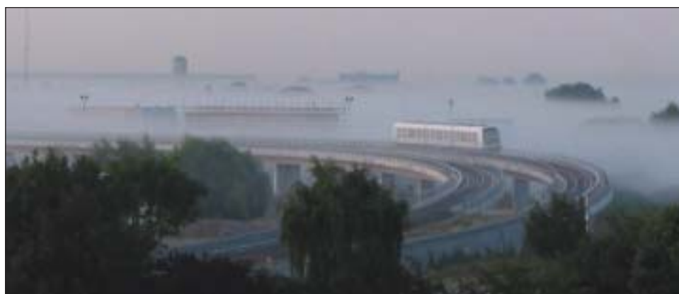
Ørestadsselskabets problemer er ved at nå groteske dimensioner, mener de radikale.

»Københavnere mod fejlplacerede højhuse« arrangerer et borgermøde den 31. august klokken 19 i gymnastiksalen på Christianshavns Skole, Prinsessegade 45, hvor man kan give sin utilfredshed med projektet til kende.