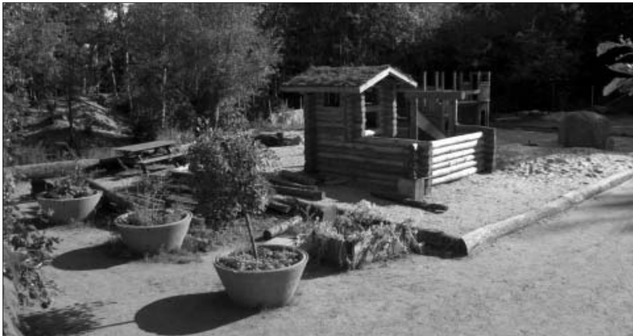
Børnehaven Anna Poulsens Minde har fået opsagt sin hyggelige legeplads.