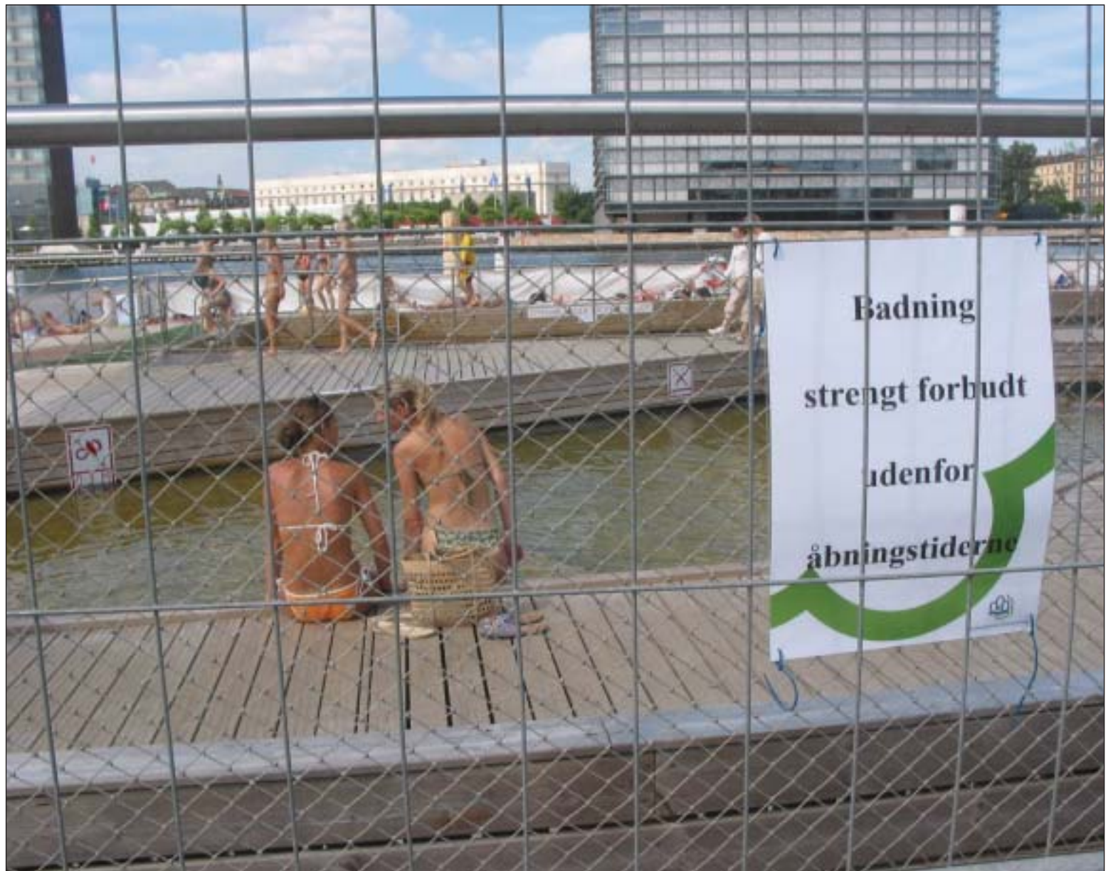
Havnebadet genåbnede to dage efter ulykkerne med et større hegn og tydeligere skiltning.

Havnebadet lukker i øvrigt ned for vinteren den 31. august, medmindre et eventuelt strålende sensommervejr får kommunen til at forlænge sæsonen. agn