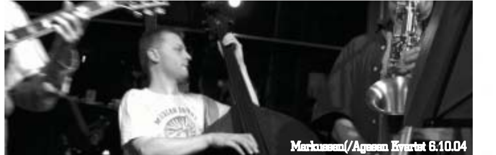
Markussen/Agasen Kvarter 6.10.04

, 6 " 9 4 IRSDAG D NOV KL !LLE MENNESKER HAR EVN #NATRVO XANSEAPPARAT OG HAR SAMTIDIG OPBYGGET EN FORBINDELSE TIL DEN OLATFORMSCLAIRVOYANCE OG LIDT OM CLAIRVOYANCE