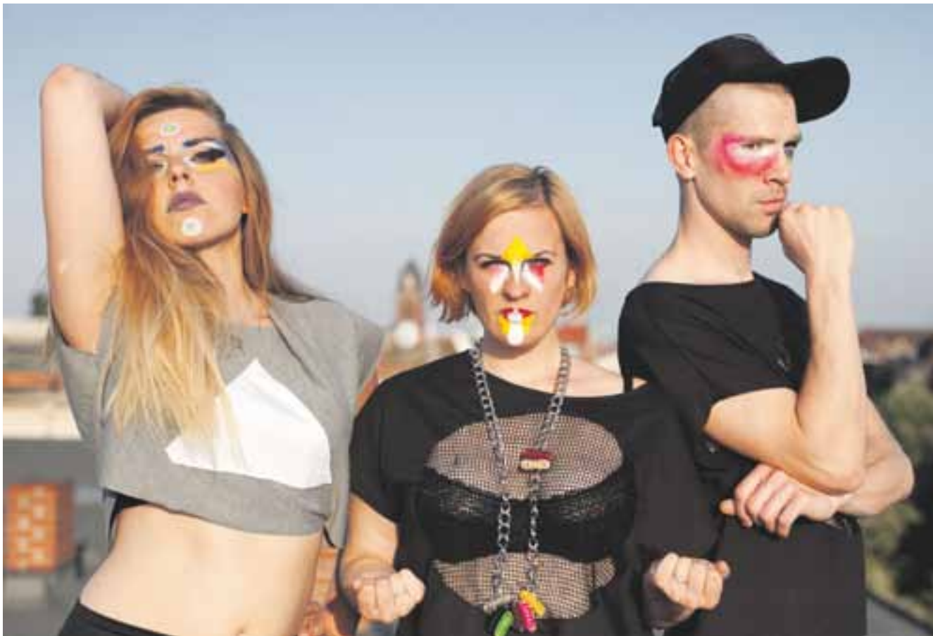
Plateau Repa spiller til dans i Kulturhuset.

Minifestival ved Kulturhuset med ølskum, bølgeskvulp og elektroniske kvinder