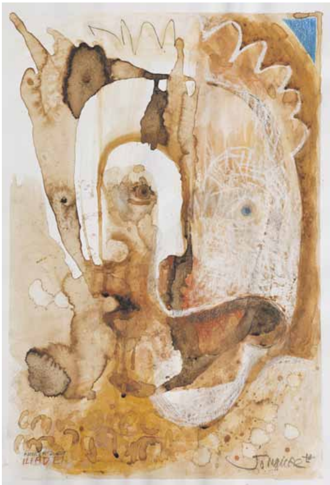
Jo Møller: Iliad, God and the warrior (maleri på papir).