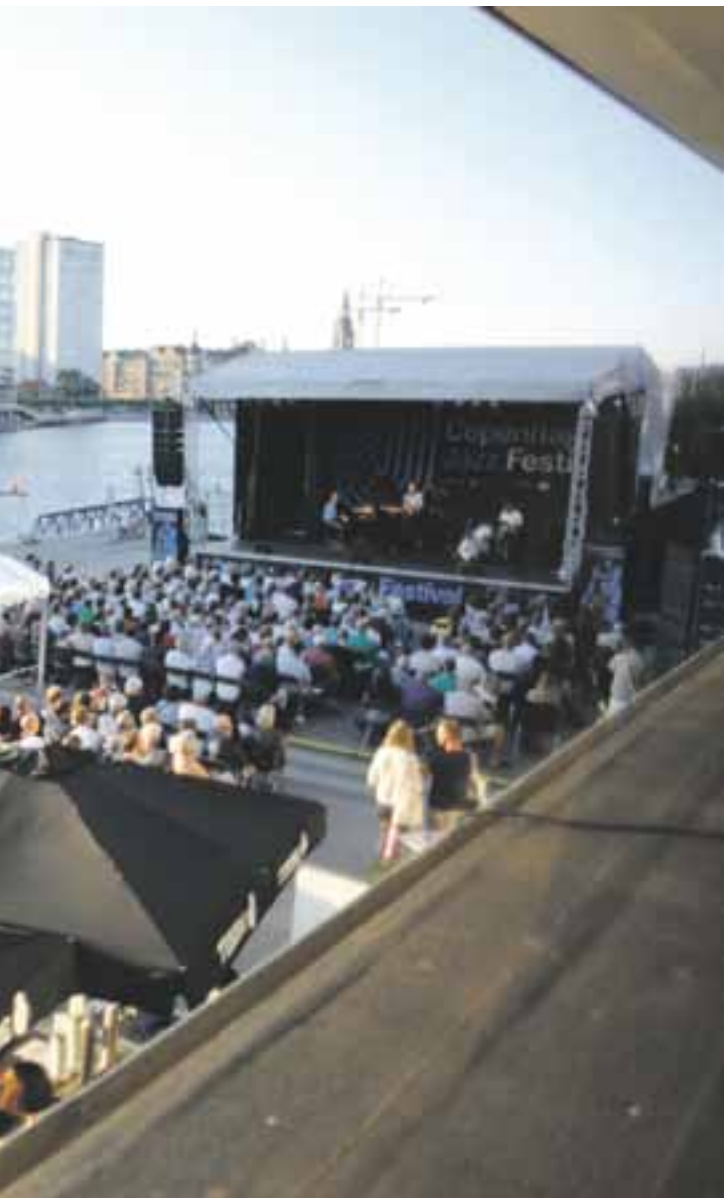
Jazz og vand spiller godt sammen.