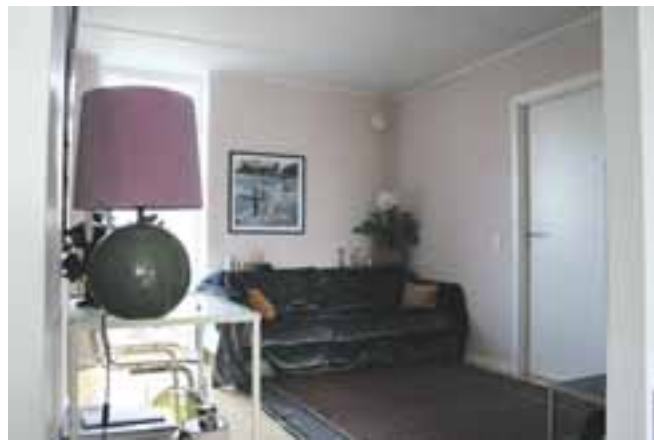
Stuen fra én vinkel...