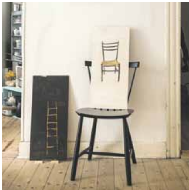
Det eneste rigtige sted til et maleri af en stol: en stol.

Tekst: Kenneth Dürr redaktion@bryggebladet.dk