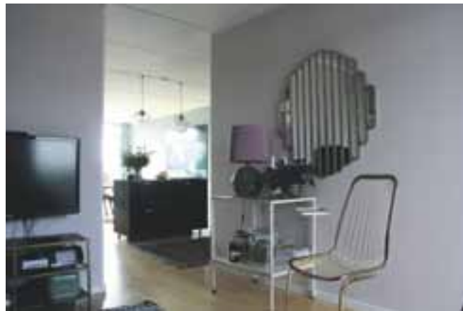
... og stuen fra en anden vinkel.