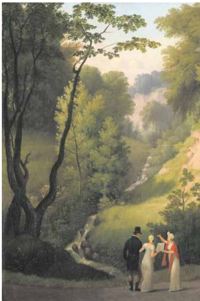
Djævlekløften hedder dette smukke og dragende billede fra Møn – men søg lige og se de rigtige proportioner.

Tekst: Thomas Neumann Illustration: C.W.Eggersberg/ SMK redaktion@bryggebladet.dk