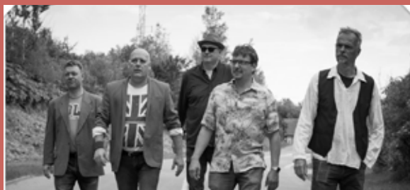
Dire Straits Jam Lør. 06. mar. kl. 21.00