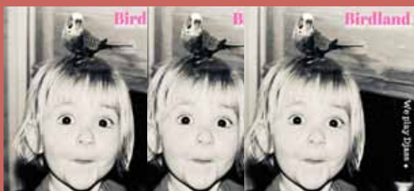
Birdland- Vinterjazz Tor. 18. feb. kl. 20.00