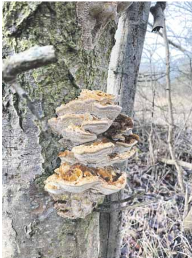
Ellespejlporesvamp findes blandt andet på Fælleden.

I Danmark har vi i omegnen af 4000 svampe, som kan ses med det blotte øje. Men det er estimeret, at der findes så mange som 50.000 forskellige svampearter i den danske muld. Men lær gerne én promise af dem, eller blot små 50 svampe, at kende