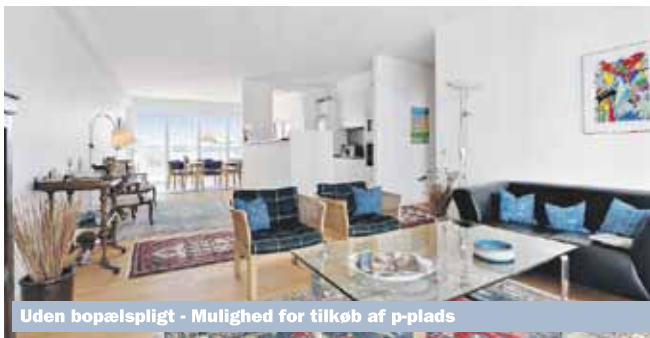
København S - Islands Brygge 75B, 5.