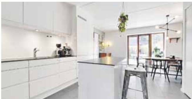
Radiatorækkerne - Tom Kristensens Vej 41