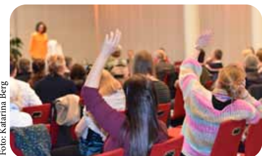
200 borgere deltog ved vores borgermøde om overdækning i 2022.

Derfor vil vi i 2023 bl.a. inddrage borgerne i spørgsmålet om, hvor de syntes, der trængte til træer i deres bydel. Vi har allerede planer om at afholde borgermøder ude i naturen. Hold dig opdatet på vores hjemmeside og sociale medier!