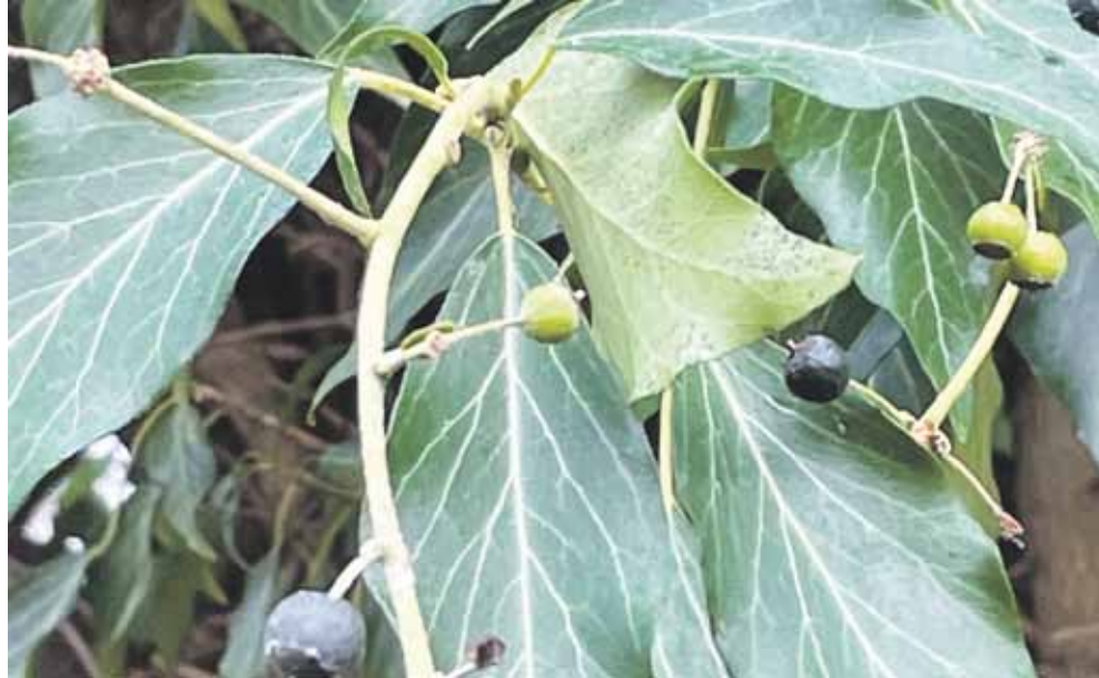
Vedbend er ej busk eller træ, men let at spotte

Der findes naturligvis nøgler til den slags, her er et par tips. Birk er nok den letteste med den hvide bark. Ask er den eneste, der har sorte knopper. Ahorn har grønne knopper som en af de få. Hvidtjørnen er overalt på fælleden, og dens torne og de røde knopper er gode kendetegn. Store ege kan findes ved indgangen til fælleden ved Halfdansgade. De står lige til venstre på skolen grund. Deres bark bliver mere og mere furet og skorpet med alderen. Men det gør gamle asketræer og navr egentlig også, men måden, trækrønen er på egen,